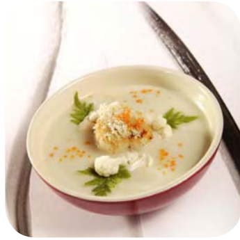
Bloemkoolsoep met St. Jacobsvrucht