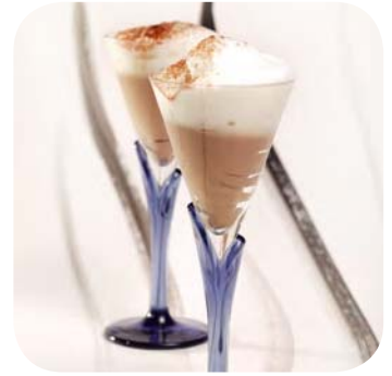
Chocolademousse met melkschuim