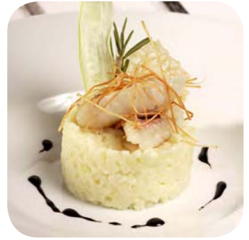
Risotto met prei en zeebaarbeel