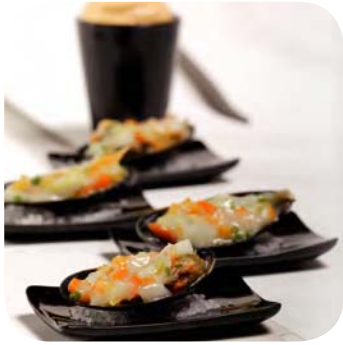
Mosselen met een rode curry espuma