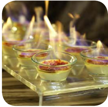
Crème brûlée van ganzenlever