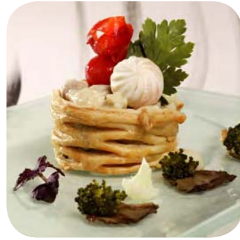
Vol au vent